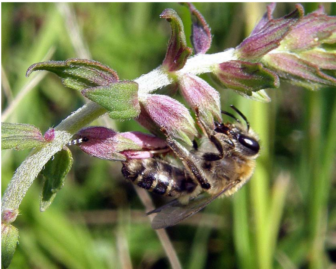
Bild 10: Weibchen der Sägehornbiene Melitta tricincta an Blüten des Roten Zahntrostes