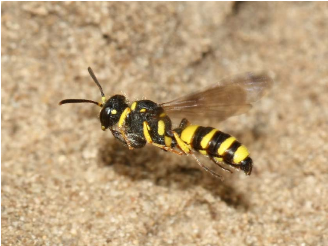
Bild 9: Weibchen der Grabwespe Cerceris quadricincta im Flug, einen Rüsselkäfer zum Nest tragend